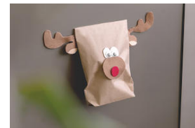
DIY Gift Bags with magnetic closure