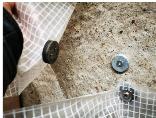
En el suelo y la entrada he utilizado 3 arandelas galvanizadas de 3 mm de grosor (orificio: Ø 11,5 mm) como contrapieza para los imanes. Desafortunadamente, el catálogo de supermagnete.fr todavía no incluye unas arandelas de acero inoxidable tan grandes ;).