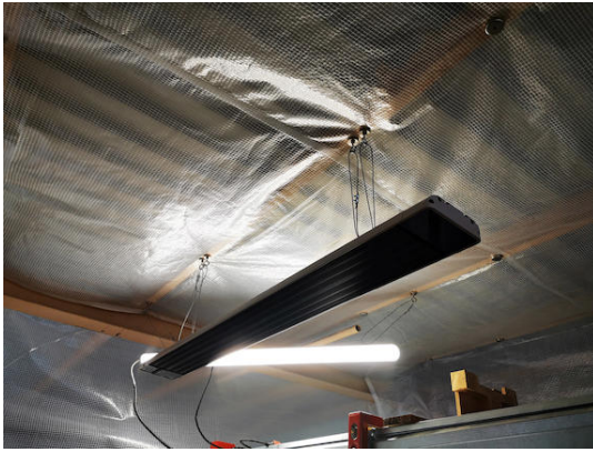
Sujeción al techo de la calefacción de infrarrojos relativamente pesada: 4 OTN-40 - Imanes en recipiente con hembra ( www.supermagnete.fr/spa/OTN-40 )