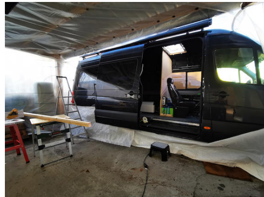
Sujeción en el vehículo y los bordes de las láminas: ITNG-40 - Imanes en recipiente de goma con rosca interior M6 ( www.supermagnete.fr/spa/ITNG-40 )