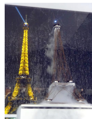
Torre Eiffel y su "hermanita" de noche

"Aquí" ( www.supermagnete.fr/spa/projects/superconductor ) encontrará más aplicaciones de nuestros clientes relacionadas con la «superconductividad».