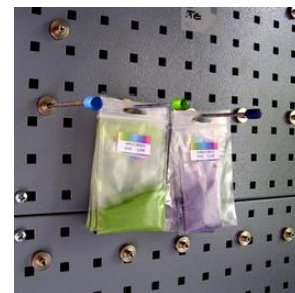
Sachets plastiques suspendus