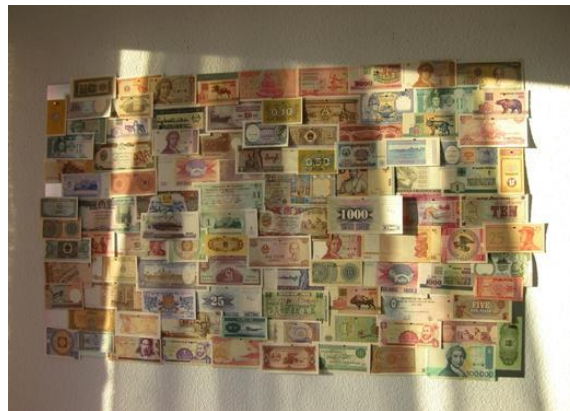
Fixation horizontale avec billets de banque