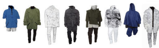
Voici un aperçu de la collection complète (8 tenues)

Toute ma collection a été influencée par le magnétisme : J'ai utilisé des parties détachables et des fermetures magnétiques pratiquement partout.