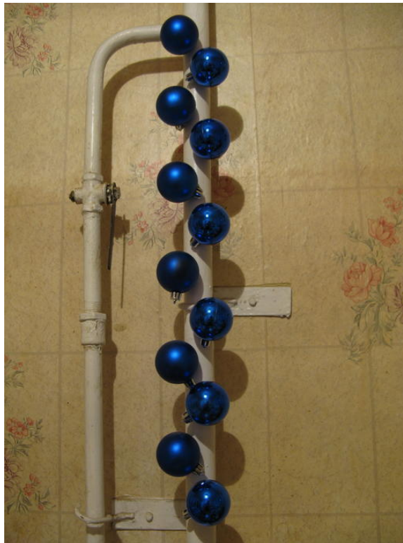
Les boules embellissent par exemple de vilains tuyaux dans la salle de bains.