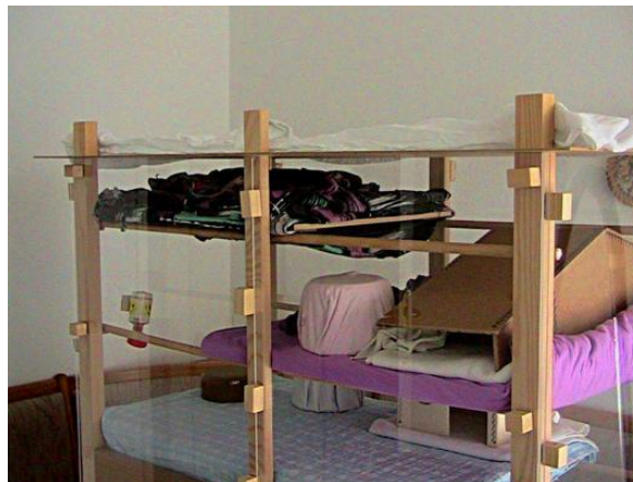
Maison de vacances équipée

Pour fixer le sol, j'ai utilisé des ferrures qui sont maintenues par des aimants Q-40-10-05-N ( www.supermagnete.fr/Q-40-10-05-N ). Je ne le referais pas aujourd'hui : pour le sol, on peut prendre des aimants au lieu de ferrures et les enfoncer dans les côtés du sol. L'article n° Q-15-15-08-N ( www.supermagnete.fr/Q-15-15-08-N ) suffirait pour cette caisse.