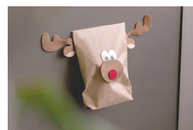
DIY Gift Bags with magnetic closure