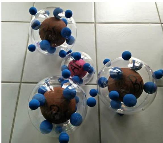
Bromuro di alluminio \text{AlBr}_3