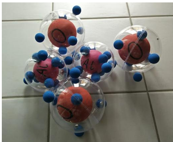
Ossido di alluminio Al 2 O 3