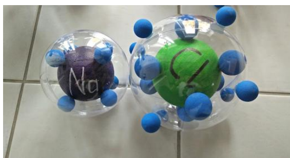
Sale da cucina NaCl, fronte

Il mio modello è stato realizzato per scopi didattici. Si tratta dell'illustrazione del passaggio degli elettroni nella formazione del sale per alunni della terza media e della prima superiore. Principio: gli elettroni (rappresentati da sfere in polistirolo) aderiscono magneticamente ai nuclei atomici (sfere in plexiglas che contengono le particelle atomiche). Quando due atomi si toccano, gli elettroni cambiano di atomo, ecco perché ho usato magneti di diversa potenza.