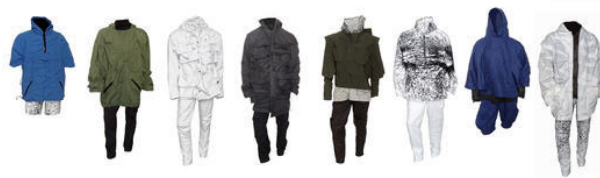
Una panoramica dell'intera collezione (8 completi)

Tutta la mia collezione è influenzata dal magnetismo: quasi ovunque sono state inserite delle parti staccabili e delle chiusure magnetiche.