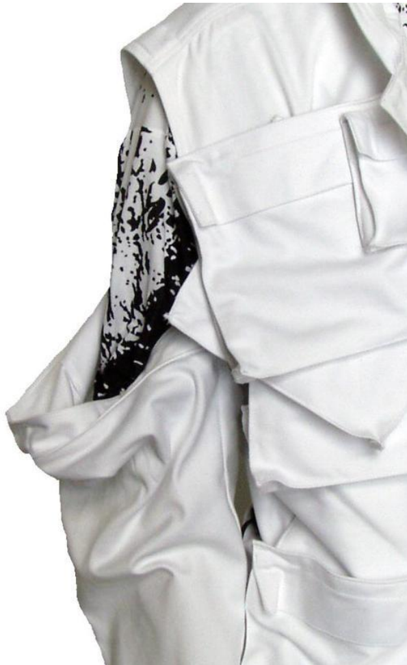
Vista in dettaglio della manica staccabile