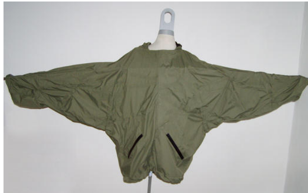
La giacca in tutta la sua estensione