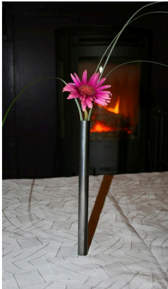
Sembra che il vaso stia in piedi da solo sul tavolo senza cadere.