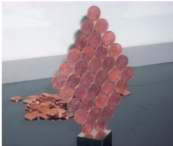
La cosa davvero difficile è riuscire a staccare le monete dal COLOSSO!

Con un COLOSSO ( www.supermagnete.fr/ita/Q-40-40-20-N ) e molte monete da 5 centesimi ho realizzato diverse sculture. La forza di attrazione di un COLOSSO è davvero sbalorditiva: riesce a sostenere fino a dieci file di monete da 5 centesimi! E persino attraverso il ripiano di uno scaffale da cucina, spesso almeno un centimetro, trattiene ancora nove file delle stesse monete (vedi sotto)!