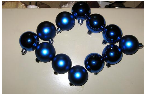
Le palline possono essere disposte a formare delle figure geometriche...