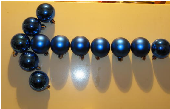
... oppure indicare la strada verso il bagno / l'uscita