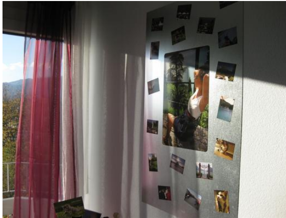
Vertikale Anbringung mit Fotos