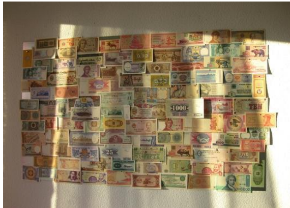
Horizontale Anbringung voller Banknoten