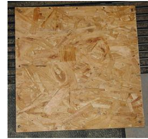
Deckel mit Eisenschrauben

Ich habe in die Unterseite des Deckels 16 Eisenschrauben an den gleichen Stellen wie die Magnete geschraubt. Durch den Kontakt zwischen Magneten und Schrauben liegt der Deckel satt auf der Kiste und fällt nicht ab, auch wenn die Kiste gekippt wird. Ein unbeabsichtigtes Öffnen wird so verunmöglicht.