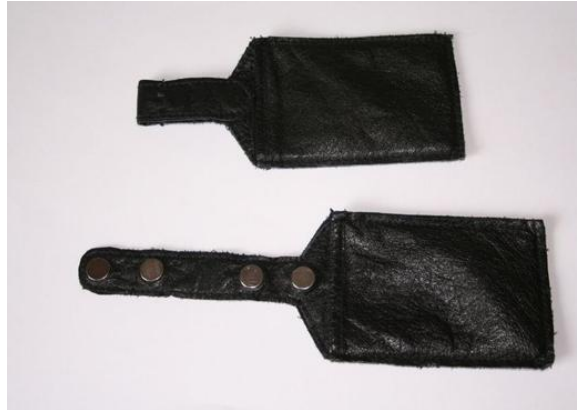
Oben ein gefaltetes Täschchen.

Beim Positionieren der Magnete ist es vorteilhaft, die 1 mm dicken Magnete auf der vom Täschchen abgewandten Seite zu verwenden. Beim Platzieren ist darauf zu achten, dass sich die Magnete des gleichen Typs abstossen, sonst faltet sich das Leder am falschen Ort.