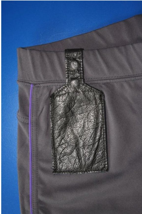
Täschchen an der Aussenseite der Trainingshose