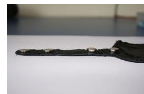
Die dünnen Magnete werden links, die dickeren rechts befestigt.

Zuerst habe ich zwei Stücke nach obigem Schnittmuster aus dem Leder ausgeschnitten. Dann hat meine Frau das Ganze inklusive Kantenverstärkung zusammen genäht, wodurch einerseits das Täschchen für die Karte und andererseits ein Kanal für die Aufnahme der Magnete entstand.