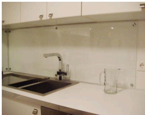
Der montierte Spritzschutz, noch ohne Verzierung