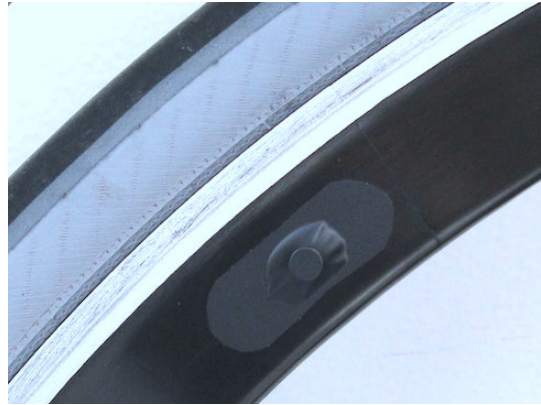
Der aufgeklebte Supermagnet im Detail

Das Klebeband hat bis jetzt über 1000 km gehalten, ohne sichtbare Spuren, dass es sich demnächst ablösen könnte. Eigentlich habe ich die Befestigung mit Klebeband nur während der Testphase vorgesehen, später werde ich den Magneten mit UHU MAX REPAIR ( www.supermagnete.fr/ger/WS-ADH-01 ) auf die Felge kleben. War bis jetzt noch nicht nötig, habe aber notfalls auch noch 9 Stück übrig, da die Mindestbestellmenge 10 Stück beträgt.