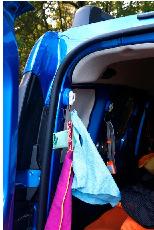
Van magneethaak tot handdoekhouder

Echt praktisch zijn de dubbelhaakmagneten ( www.supermagnete.fr/dut/M-90 ) als handdoekhouder in de camper. Met de magneethaak kan men gewoon bliksemsnel een vaste plek voor je handdoeken creëren, zonder dat men in de geliefde bus of de ingebouwde meubelen hoeft te boren. Juist wanneer men zo weinig plek heeft is het super, wanneer dingen zoals handdoeken gewoon hun vaste plekje hebben. Dat zorgt aan de ene kant voor meer orde en aan de andere kant zijn de handdoeken bij behoefte supersnel klaar voor het grijpen. Ook praktisch: De handdoeken kunnen aan de haken ook meteen weer goed opdrogen.