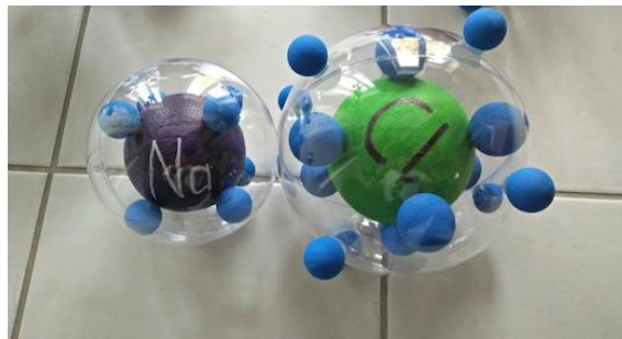
Keukenzout NaCl, voorkant

Mijn model werd voor lesdoeleinden vervaardigd. Het gaat om het verduidelijken van de elektronenovergang bij de zoutvorming voor leerlingen van groep acht resp. negen. Principe: Elektronen (verbeeld door styroporkogels) hechten magnetisch aan atoomrompen (acrylglazen kogels, die de atoombestanddelen bevatten). Bij het aanraken van twee atomen wisselen de elektronen van atoom, vandaar ook de verschillend sterke magneten.