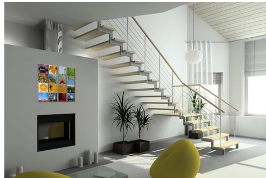
Cd wand in de woonkamer met een Cd Wall Square 4x4 voor 16 cd's

Behoort u ook tot de mensen, die van muziek houden, maar van mp3's niet blij worden? U houdt van geweldig design en bladert bij het horen van muziek graag in de cd-boekjes? Jammer toch, dat u uw mooiste cd-covers in normale cd-rekken verstopt.