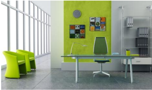
Cd wand op kantoor met een Cd-Wall Square 3x3