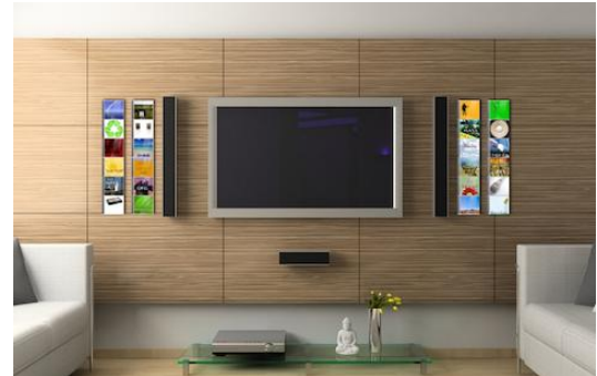
Cd wand in de woonkamer met een combinatie van Cd-Wall Slim modules