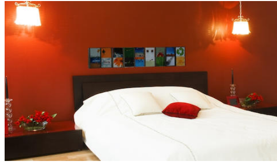
Cd wand in de slaapkamer met een combinatie van Cd-Wall Slim modules