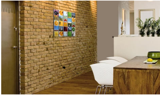
Een cd wand in de eetkamer, CD Wall 5x5 voor 25 cd's